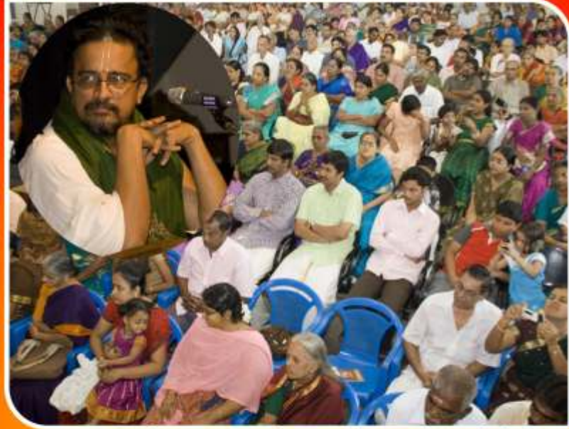
ஜனவரி 1, அசோகநகர் மஹோதயா ஹாலில் காலை ஸ்ரீஸ்வாமிநிதிஸ் தரிசனம் மற்றும் உபஸ்யாசம்