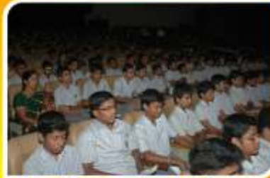
GOD ஆத்தியா டிரஸ்டு சார்பாக , ஜனவரி 23 அன்று தேனமம்பேட்டை காமராஜர் அரங்கில் மானவமணிகளுக்கான மஹாமந்திர ஆட்சிப்பிரார்த்தனை நடைபெற்றது. மேல் , ஆடது நடு - உரை ஆற்றிய அட்பர்கள்: கீழ் , வலது நடு - அரங்கத்தினுள் ஒரு பார்வை.