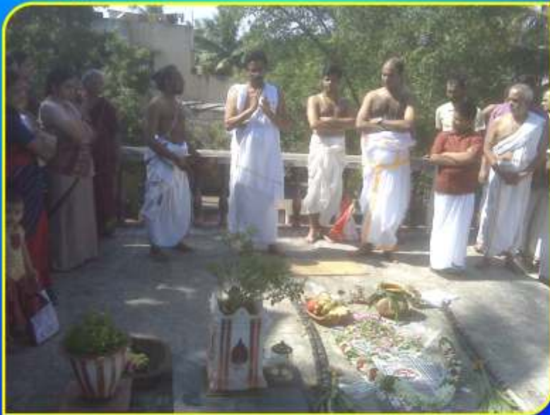
சென்னை பிரெஸ்பிசு பள்ளத்திில் இலவல் 14 வாரிசில் அன்று சூரியநமஸ்காரத்திற் பூசை