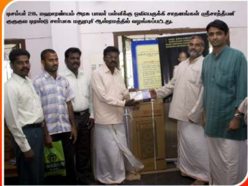
டிசம்பர் 28, மஹாரணியம் அரசு பாலர் பள்ளிக்கு ஒன்பதுக்க சாதனங்கள் ஸ்ரீசாந்தியன் குகுகல டிரஸ்டு சார்பாக மதுரபுர் ஆஸ்ரமத்தில் வழங்கப்பட்டது.