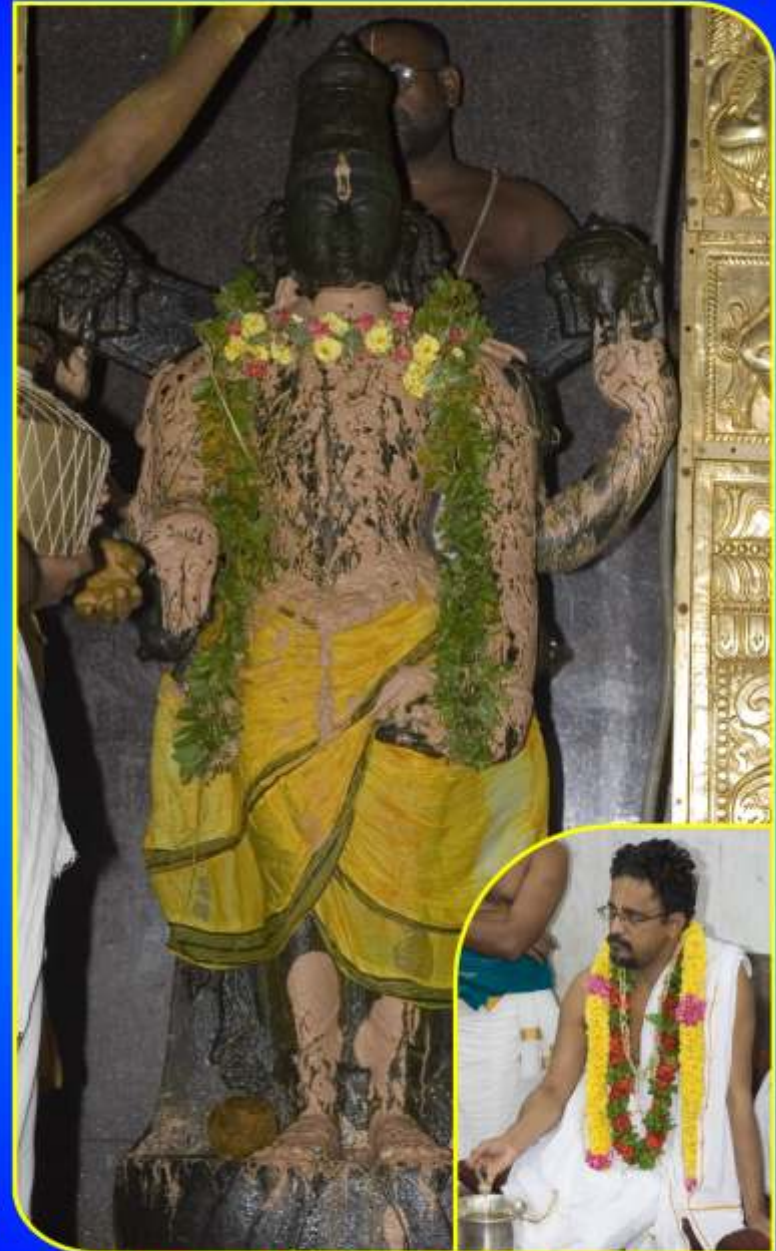
புதுப்பள்ளியில் ஸ்ரீகல்யாண ஸ்ரீனிவாச சவுடிராசன் கோவில் பிரதீபிப்பாதிசல் இலவல் 20